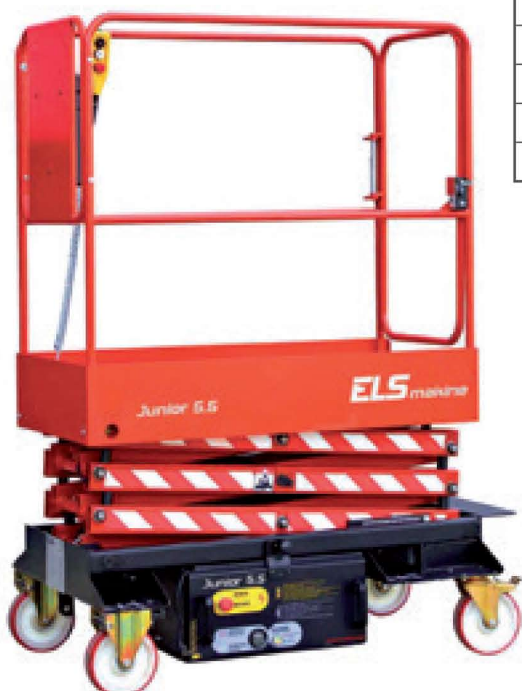
Outstanding capacity provides long endurance Les batteries à forte capacité permettent une longue période de travail