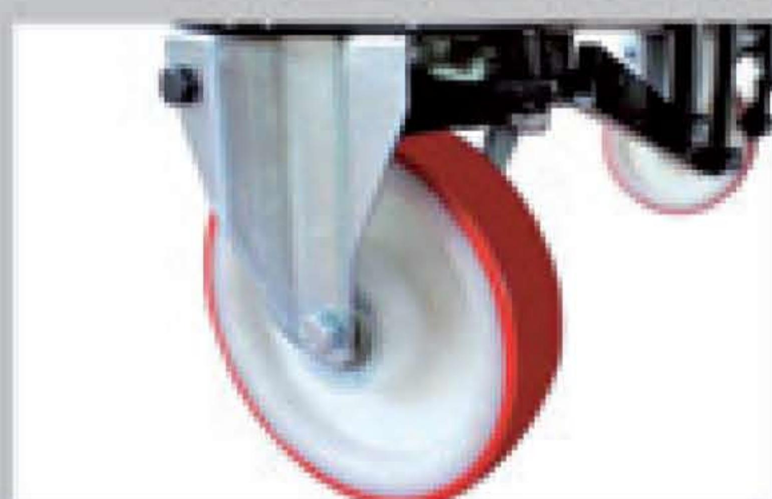
Auto braking on castors Freinage automatique sur les roulettes