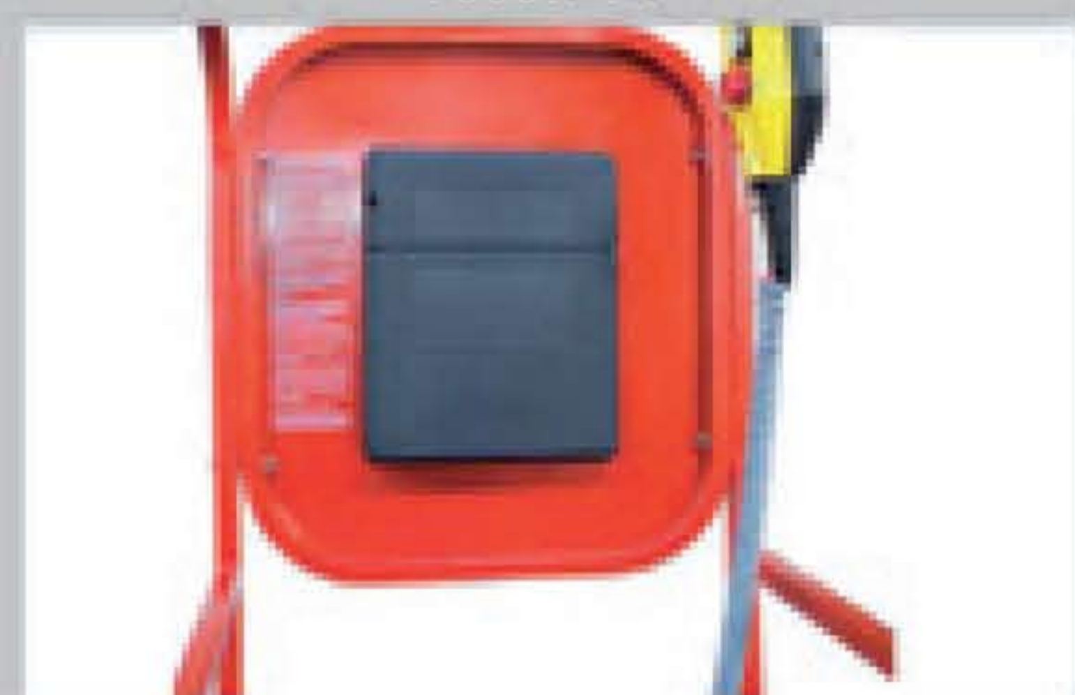
Operator briefcase Malette de l'opérateur