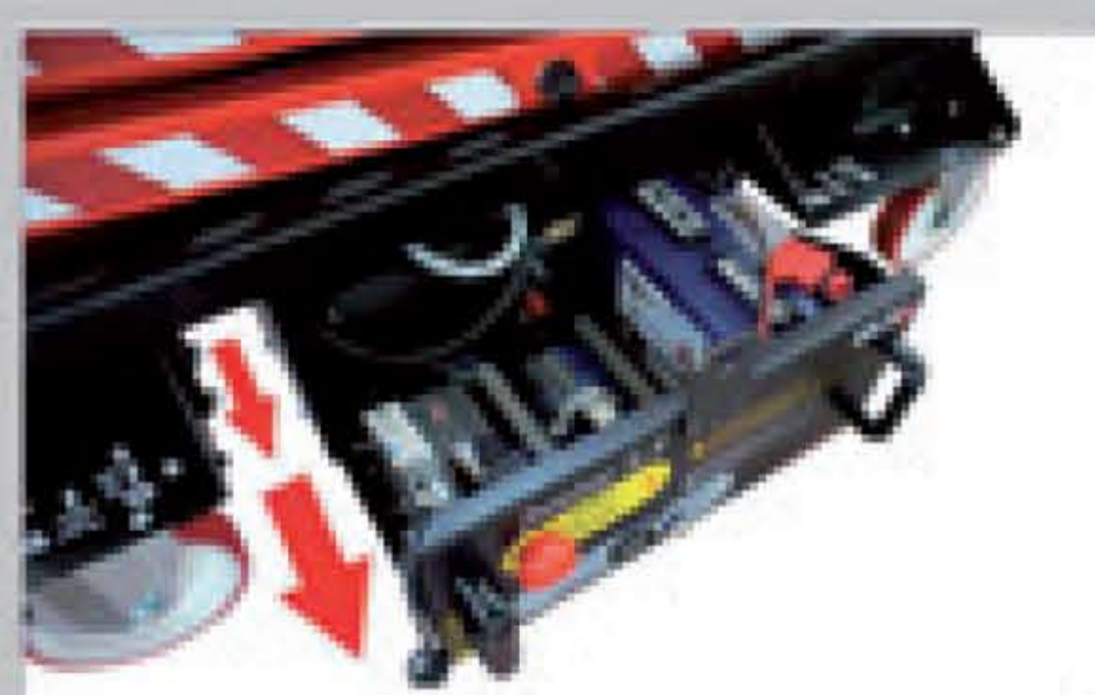
All the component parts are easily accessible for servicing La partie composant est facilement accessible