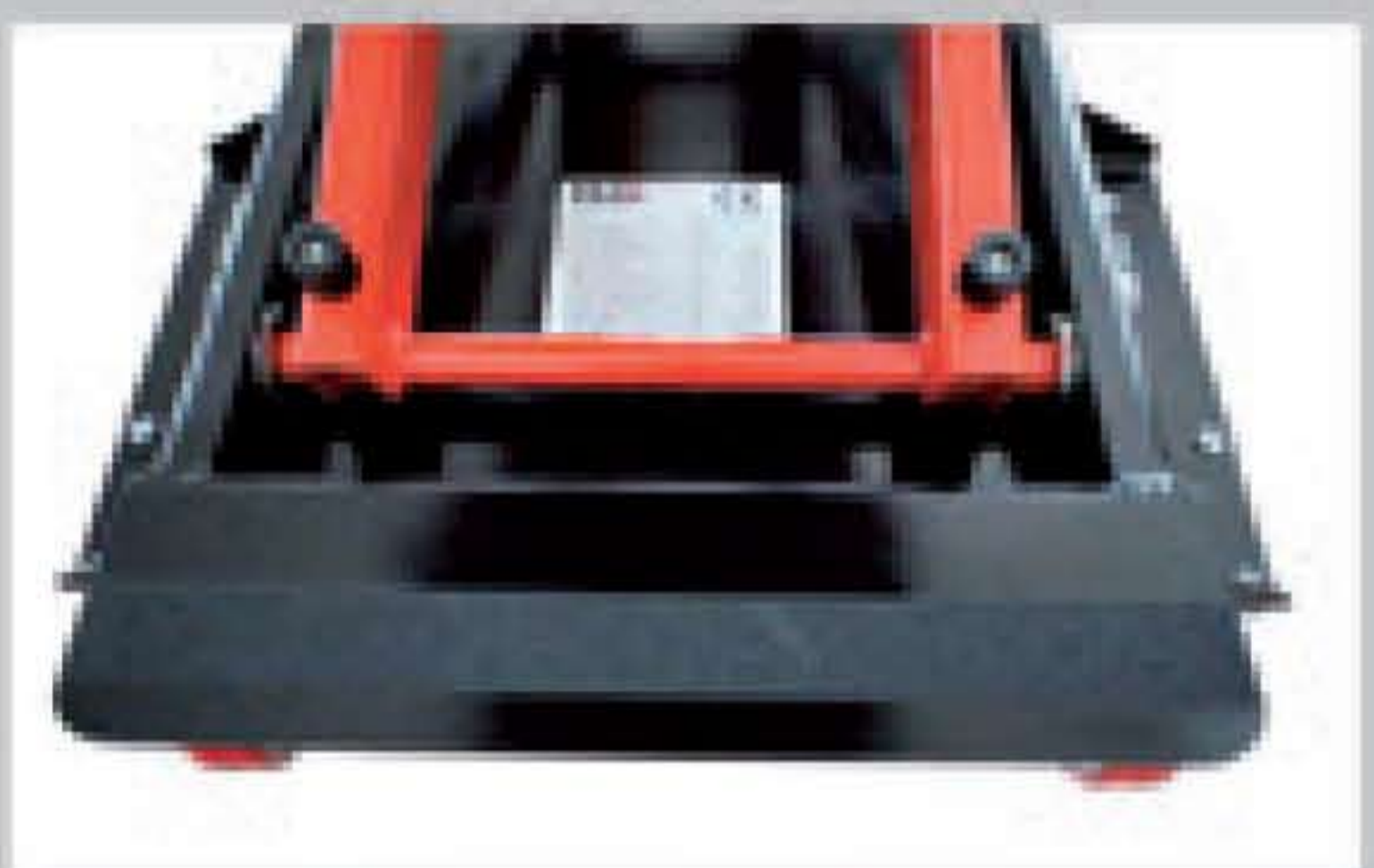
Functional chassis design for easy cleaning Design fonctionnel pour un nettoyage facile